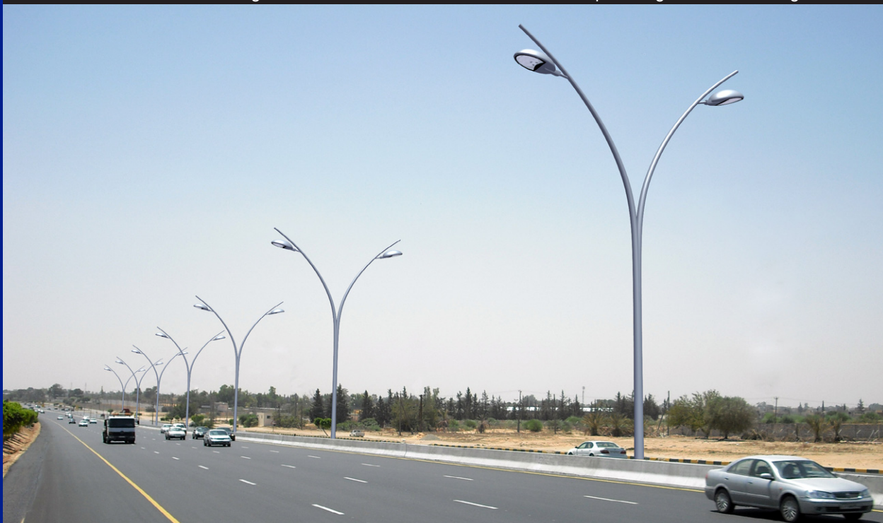
▼ Fotorealistische Visualisierung in der Örtlichkeit