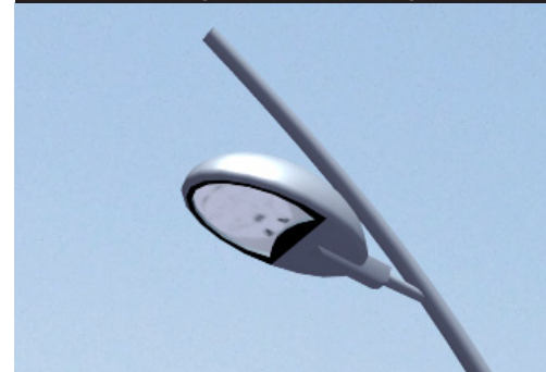
▲ Lampendesign Herstellervorlage