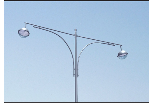
▲ Lampendesign Herstellervorlage