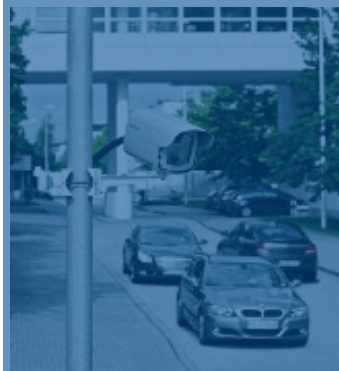
Das ANPR-Kamerasystem bietet eine breite Palette an Anwendungsmöglichkeiten: bei Geschwindigkeitsmessungen, bei der Reisezeitmessung sowie bei der Mauterfassung und bei Parkkontrollen und Sicherheitsanwendungen

V-Kon.media GmbH Max-Planck-Straße 12 D-54296 Trier www.vkon-media.de