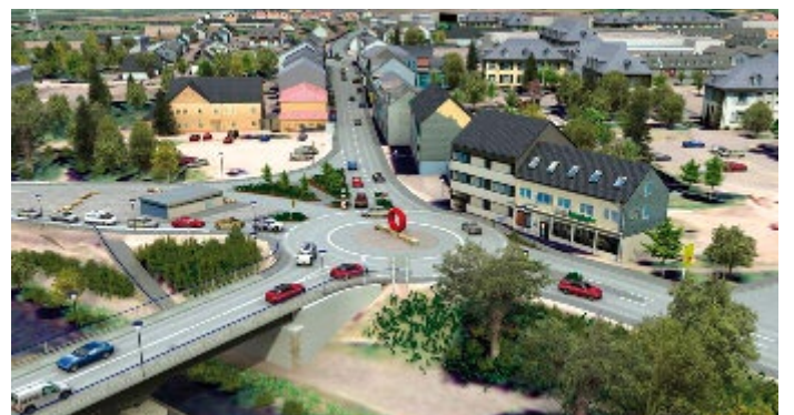
Visualisierungen unter echtem Verkehr ist ein Meilenstein in der Entwicklung qualitativ hochwertiger 3D-Darstellungen und eröffnet völlig neue Wege bei der Planung von baulichen Veränderungen als auch bei der Überprüfung möglicher Planungsvarianten

Es gibt viele Möglichkeiten, ein geplantes Verkehrsprojekt zu visualisieren, aber bei diesem Pilotprojekt werden nicht nur das tatsächliche Verkehrsaufkommen, sondern auch die Fahrwege mit angepasster Geschwindigkeit realitätsgetreu wiedergegeben. Autos, die an den Kreisel heranfahren, bremsen hinter dem Vordermann ab und biegen danach mit eingeschlagenem Lenkrad in den Kreisel ein.